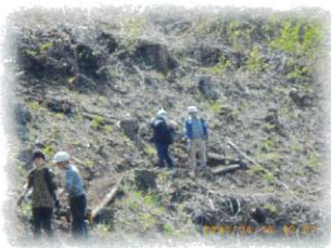
伐採後の大きな切り株