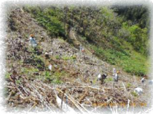
かなりの急斜面です