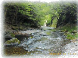
植林地そばの北秋川 こんな森を目指して

お天気に恵まれた植林地 昨年植えた苗木は立派に育っていましたが…1年でたったこれだけ？ 森の再生は気が遠くなる道程です でもいずれ必ず鬱蒼と茂る森に