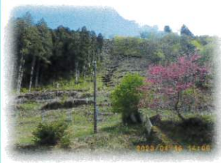
植林地全景 明かな禿山