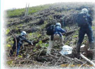
大奮闘中の植林メンバー